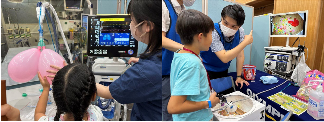
経済産業省子どもデーの様子