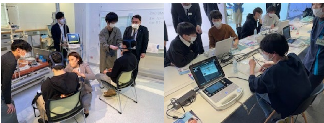
入門セミナー(ハンズオン)の様子

Y ボード部会は若手～中堅層が中心となり活動する部会です。同世代の視点からこれからのキャリアに必要な基礎知識(入門セミナー)、コミュニケーション(レクリエーション企画)、プレゼンテーションなどのノンテクニカルスキルを中心としたセミナーを展開しています。近年では、養成校と連携をはかり学生向けに講義などを行い若手の活性化を目指しています。生涯委員会とともに経済産業省こどもデーや看護フェスタなどの企画にも参加し、臨床工学技士の知名度向上の活動も行っています。2024 年度も養成校連携企画、レクリエーション企画、入門セミナーを開催予定です SNS の発信も積極的に行っておりますので、ご興味ある方は以下の QR コードより是非ご覧ください。