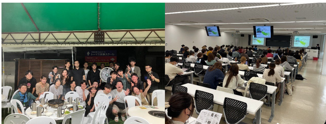
レクリエーション企画